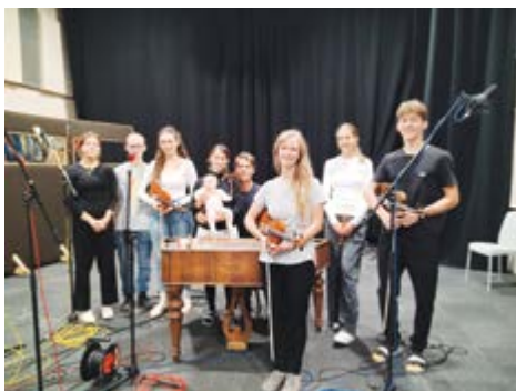
Nahrávání v ČR Olomouc