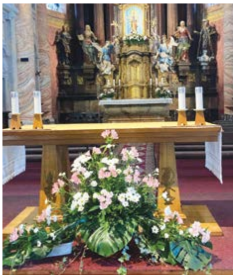
Slavnostní výzdoba kostela ve Štípě