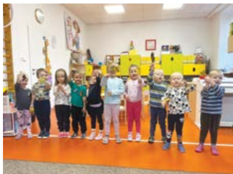
Podzim u Sluníček