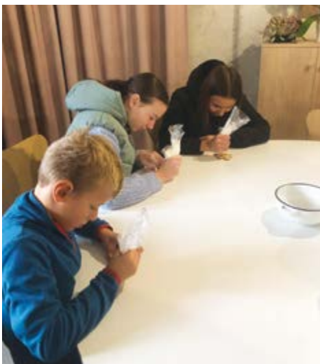
V zápalu zdobení