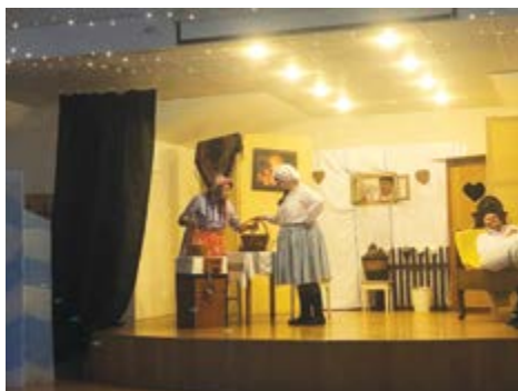
Tetka Peléščena léčí