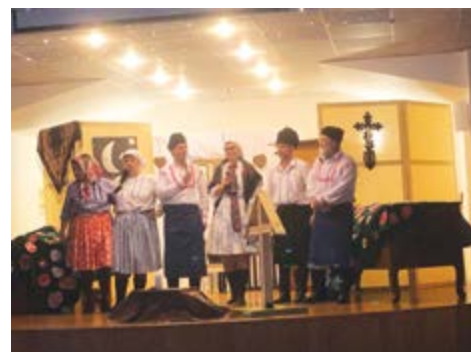
Závěrečná děkovačka herců