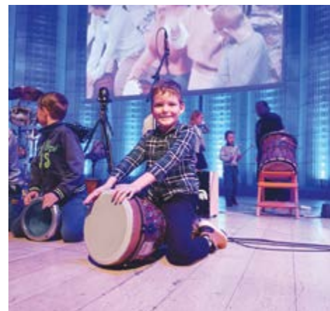
Výchovný koncert – bubny

nechovají hezky. Tyto děti potřebují pomoc. O půl desáte nám paní učitelka rozdala hudební nástroje a byl z ní dirigent. Všichni jsme začali hrát a paní asistentka vše natočila. Cílem bylo, abychom věděli, že tlouct se má třeba do bubnů a ne do dětí.