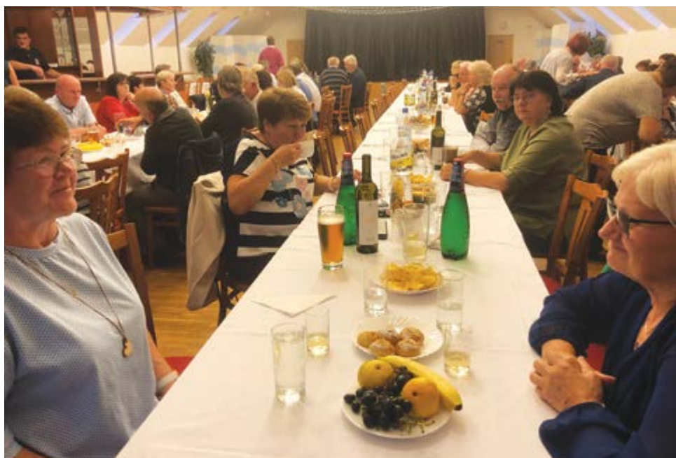
Bylo nás docela dost