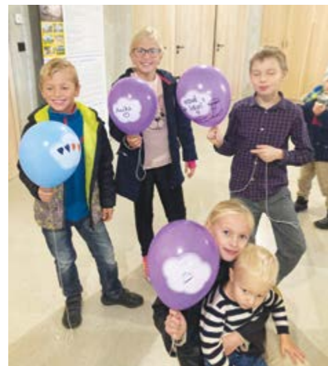
Radost z maličkosti