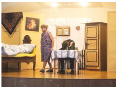
A ty se ptáš, co já?