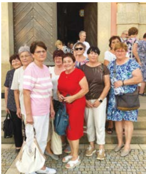
Pout' k Panně Marii do Štípy

cházejí v procesí za zpěvu písní pěšky až do lodi kostela). Opět jsme na tomto poutním místě prožili krásné, příjemné a pozeňvané odpoledne. Taky stihneme po mši posedět u kávičky, koupit oplatky a jiné drobnosti a v pohodě odjždíme domů.