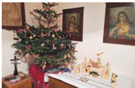
Štědrý večer u stromčku