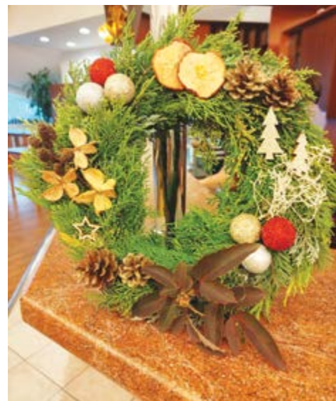
Výsledek našeho snažení