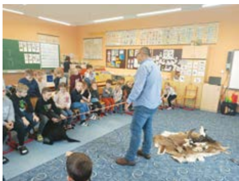
Beseda s myslivcem