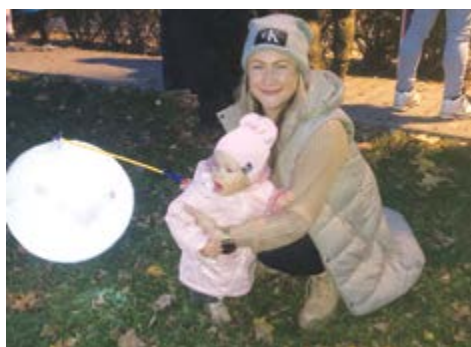
U mamky jsem v bezpečí