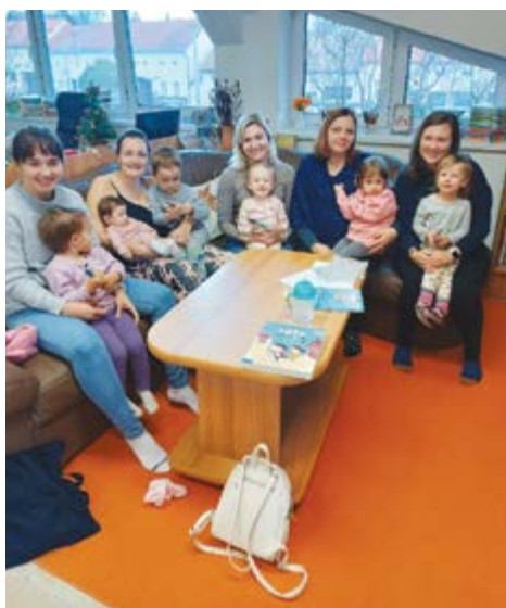
Setkání maminek a těch nejmenších