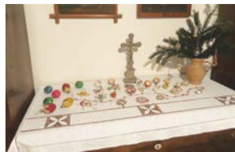
Staré vánoční ozdoby

Jako všechny předchozí roky i letos se v sazovickém muzeu uskutečnilo několik akcí určených pro děti i dospělé. Jedním z cílů muzea je přiblížit návštěvníkům, zejména dětem, tradice svátků i všedního života našich předků v podobě, v jaké se dochovaly do dnešních dnů. Zaměřuje se především na zvyky a obyčejy Velikonoc a Vánoc a snaží se tyto tradice oživit a uchovávat. Tyto pořady jsou primárně určeny pro děti sazovické základní a mateřské školy a sazovickou veřejnost, ale v poslední době projevují zájem o návštěvu muzea a připravený program také školy a školky v okolí (Mysločovice, Tečovice, Malenovice). Muzeum se snaží získávat i dosud nezaznamenaná fakta, dokumenty, fotografie a vzpomínky na život v dřívějších dobách. Tak se například ve spolupráci s místními školáky podařilo zpracovat několikaletý projekt o starých řemeslech a živnostech v obci, který v tištěné podobě vycházel v Sazovických novinách (v tomto čísle najdete jeho poslední část) a do něhož se podařilo zaznamenat vyprávění a vzpomínky řady místních pamětníků, které by jinak zanikly. I v letošním roce pokračovala