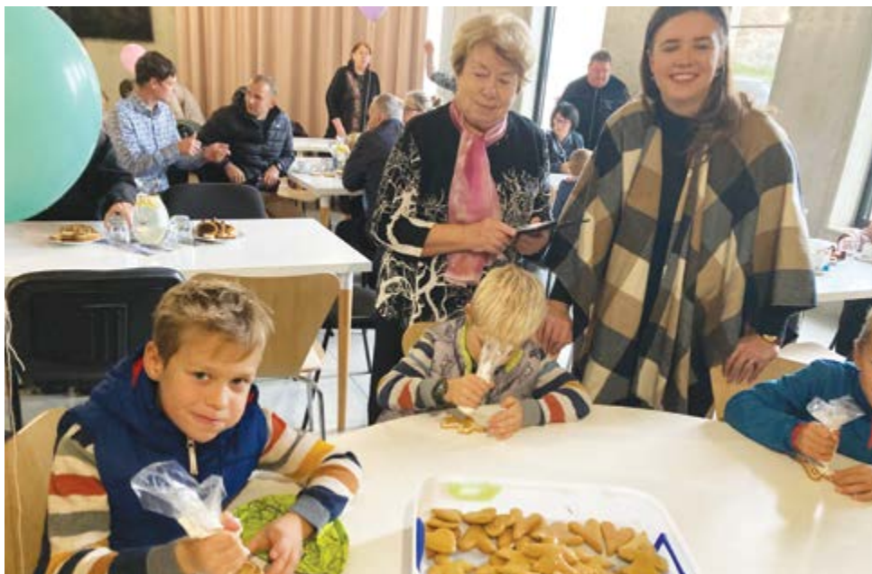
Jeden nazdobit, jeden do pusy...