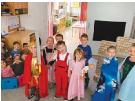
Dramatizace legendy O sv. Martinovi