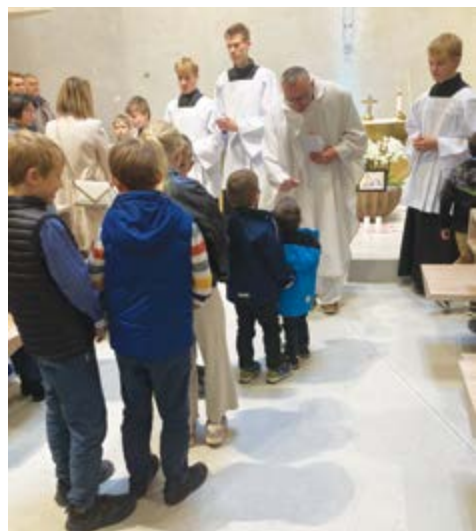
Jdeme si pro požehnání