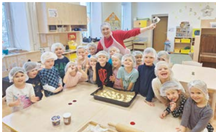
Pečeme svatomartinské rohlíčky