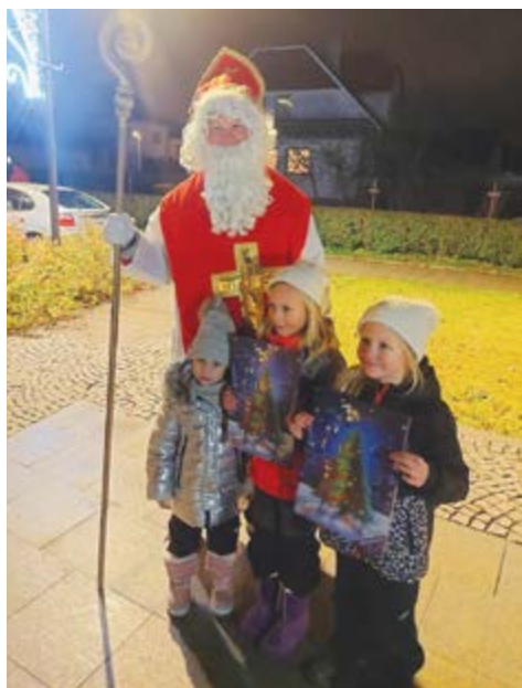
Přišel i Mikuláš

Teď už, jak to všichni známe, naberou dny do Vánoc šílené tempo. A tak vám přejeme, ať všechno stihnete: uklidit, napéct cukroví, nakoupit dárky, vyzdobit dům a hlavně být na všechny kolem sebe milí a laskaví.