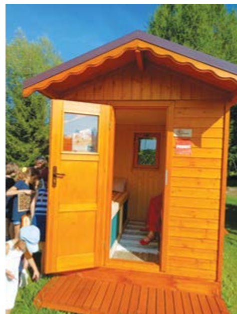
Apis domek v Nasavrkách