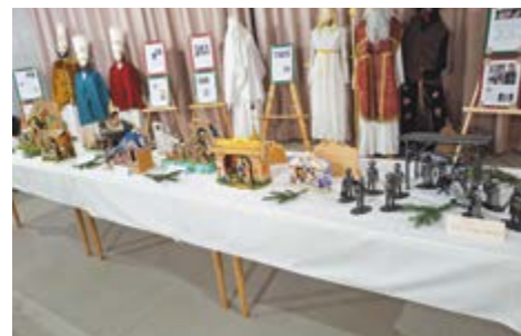
Galerie adventních postav