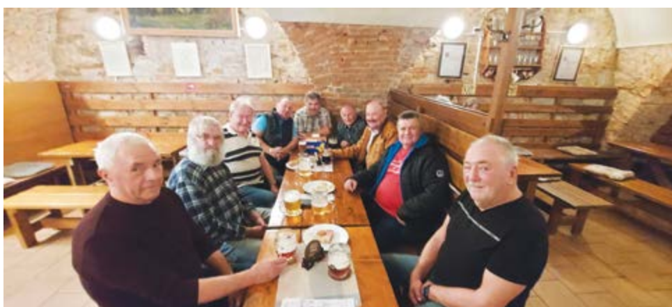
Hospůdka pivovaru Malenovice