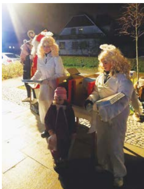
Nechyběli ani andílci