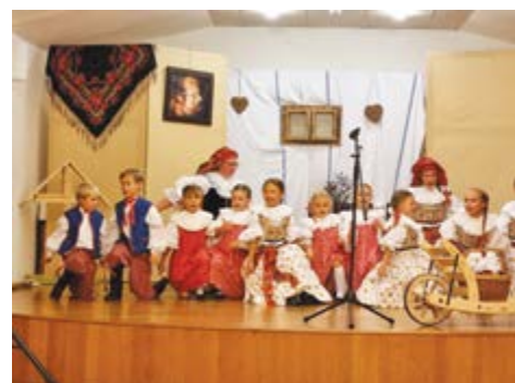
Společné vystoupení pro seniory v Sazovicích