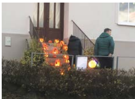
Dýňové lampiony před školou

žitek“ – když někomu lampion od svíčky „chytí“ a shoří. Dnes už totiž ve všech svítí žárovíčky na baterie... Výběr lampionů je dnes také mnohem pestřejší a nápaditější. Dříve to bývaly jenom pestrobarevné koule nebo válce, dnes můžete v průvodu potkat nejrůznější příšerky, duchy, měsíc, sluníčko, prostě na co si vzpomenete. Když se k tomu připojí i světélka ve vydlabaných dýních, například ta, která svítla na schodech u školy, získá podvečer neopakovatelnou podzimní atmosféru.