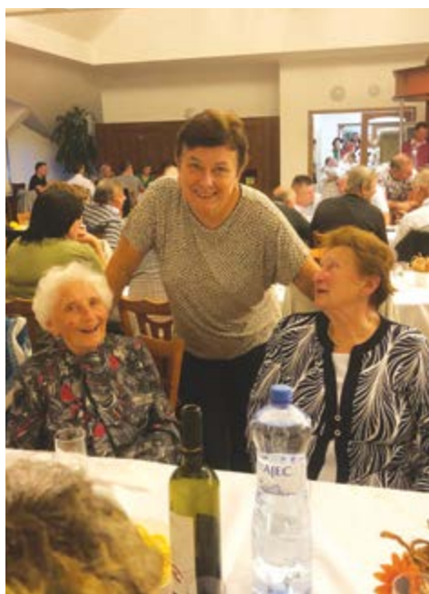
Pořád je důvod se usmívat