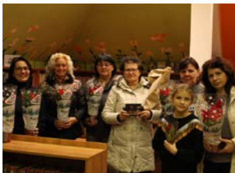
Prodej vánočních hvězd