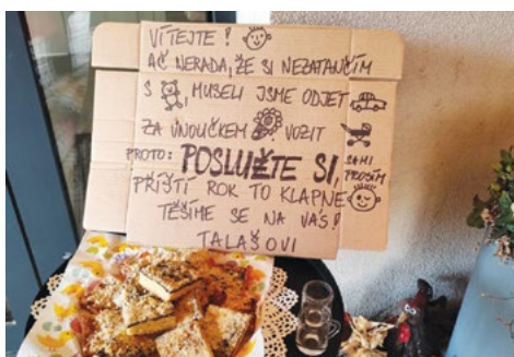
Vzkaz a výslužka pro medvěda