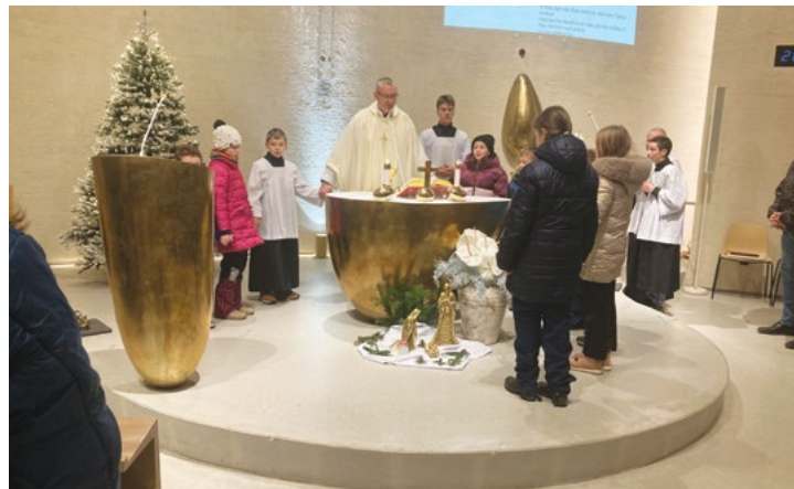
Děkovaná mše svatá