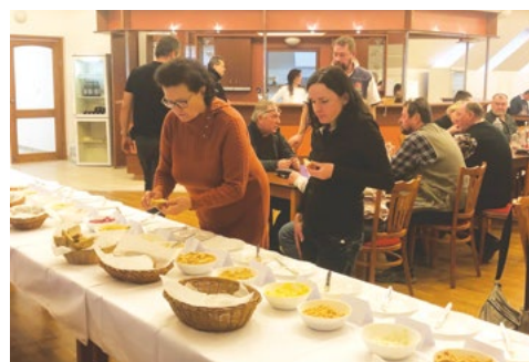
Jedna pomazánka lepší než druhá

Pro sazovické hospodynky se soutěž o nejlepší pomazánku stala také výzvou. Na ochutnání a vyhodnocení čekalo hned 18 vzorků, které si bylo možné namáznout na kousek chleba nebo kolečko rohlíku, takže kdo poctivě ochutnal všechny, docela se najedl... Výběr byl skutečně pestrý: tvarůžková, škvarková, vajíčková (ty se sešly dokonce vícekrát), dále nivová, zeleninová, pórková, ředkvičková, z červené řepy, česneková nebo haše. Některé soutěžily pod výstižnými názvy, např. ďábelská nebo upíří strach. Také pomazánky měly své vítěze: