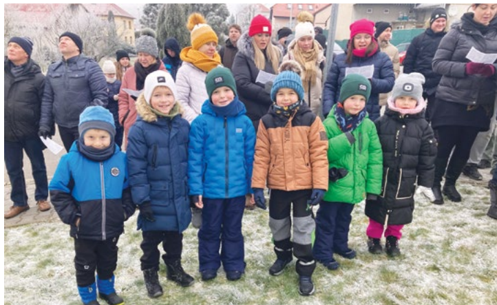
Zpíváme se zvonky