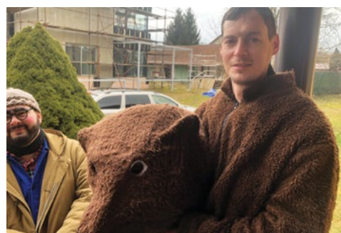
Medvěd už je ochočený

obchůzku obcí už v sobotu 1. března. V čele se valili hned dva medvědi vedení statnými medvěďáři a dalších maškar bylo kolem čtyřiceti. Byli mezi nimi tradiční kominíci, pekaři a nesměl chybět ani policajt, ale dál už pracovala na plně obrátky fantazie jednotlivých aktérů. Mohli jste potkat divoké šelmy kočkovité, fešnou Japonku v kimonu a s parapíčkem, ozbrojence v červených overalech,