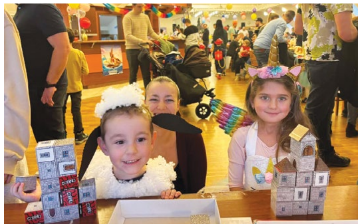
Kam se podívat dřív?