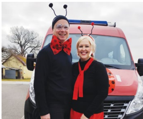
Slavná hmyzí dvojka