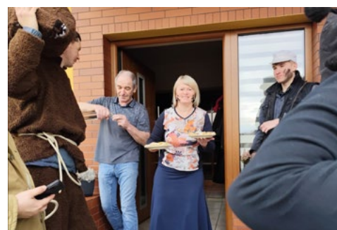
U Velíků byli doma