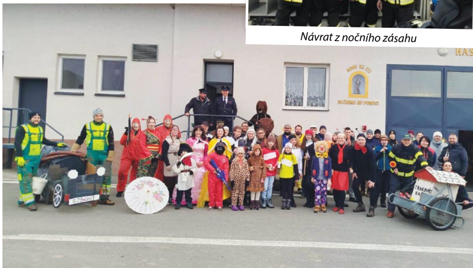
Vodění medvěda 2025 – společné foto