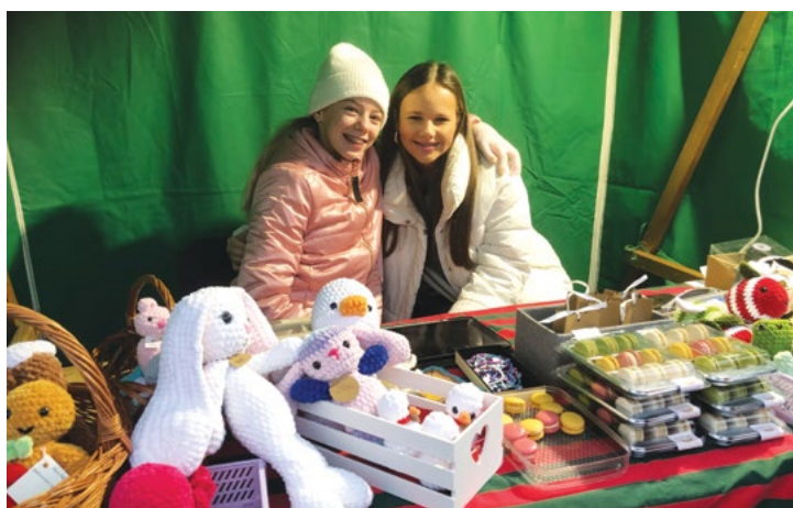
Všechno vlastní výroba!