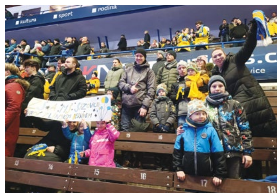
Fandíme zlínským hokejistům