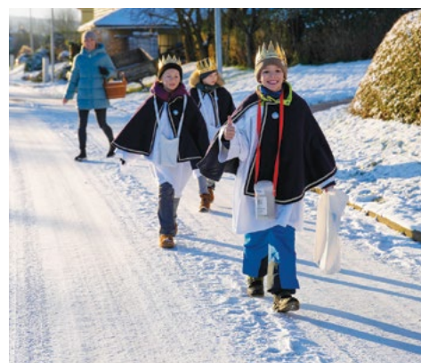
Ideální počasí na obchůzku