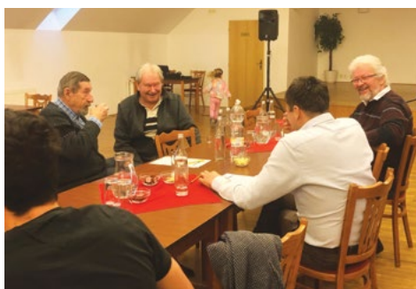
Chce to odpovědnost...

15 dkg plísňového sýru Niva, 1 bílý řecký jogurt, prolisovaný česnek a sůl podle chuti. Nivu nastrouhat na jemném struhadle, přidat jogurt, česnek a případně dosolit. Všechno důkladně promíchat.