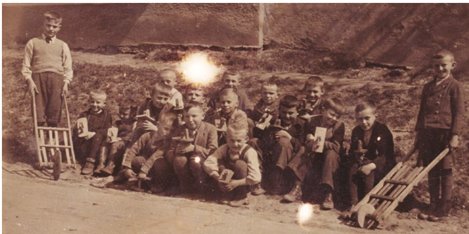
Sazovičtí klapotáči 40. léta