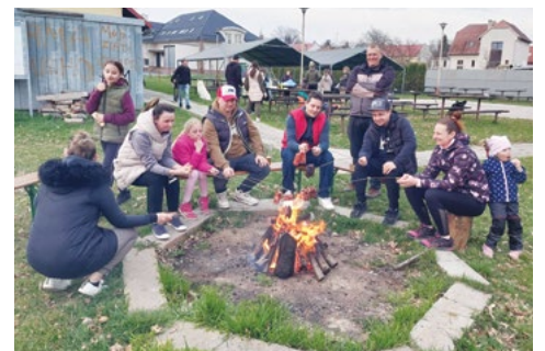
Odměna po úklidu