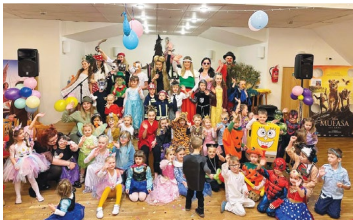
Ať žije karneval!