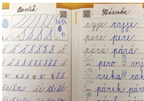
Písání se nám daří