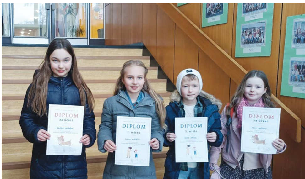
Naši úspěšní recitátoři