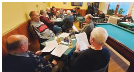
Zpíváme všichni a rádi