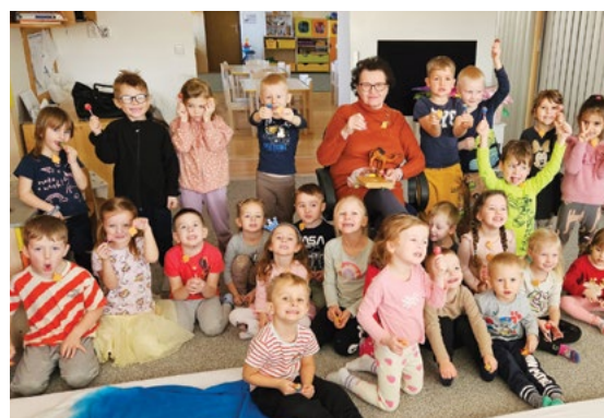
Celé Česko čte dětem