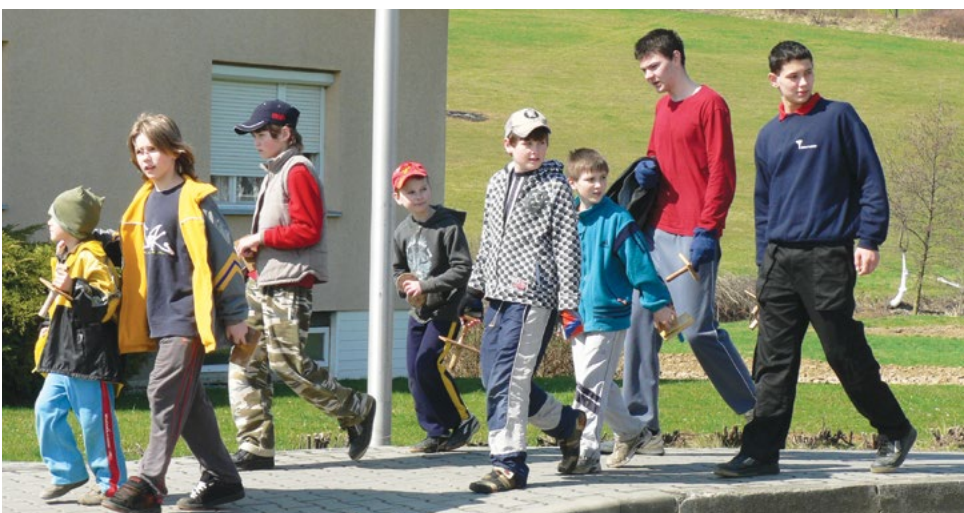
Klapotání kolem r. 2007