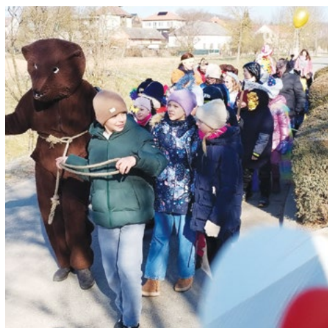
Vesele za divokou šelmou