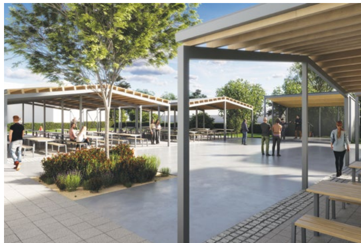
Výletisté – vizualizace