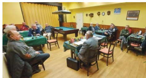
Rady pro zahrádkáře – přednáška