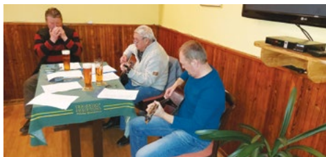
Naše country kapela