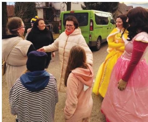
Vodění na Přídanku

Vodění medvěda se i letos sazovickým hasičům, kteří akci pořádají, skutečně vydařilo, vřdyt i počasí jim celkem přálo. Bylo chladno, ale jasno a dopoledne i slunečno. Až odpoledne se obloha zatáhla, ale na déšť nebo sníh nakonec nedošlo.