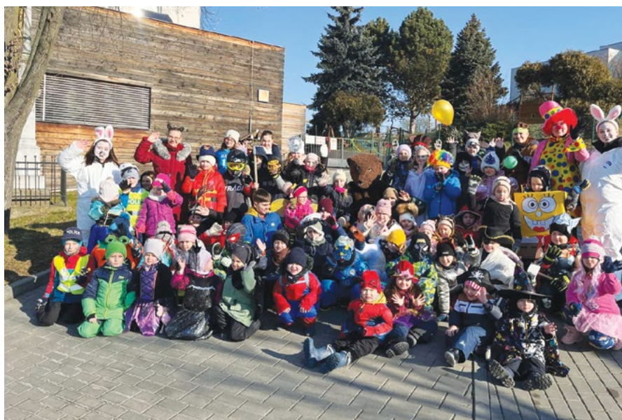
Zdraví vás školní medvěd