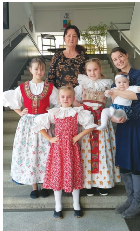
Pěvecká soutěž Trnečka