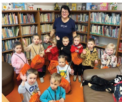
Knihovna – Sluníčka