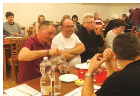
... a opravdové znalce