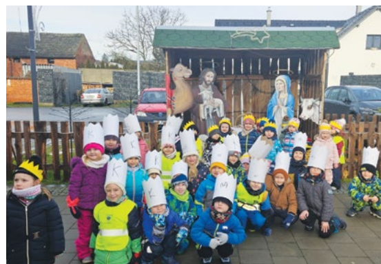
Králové jdou k Betlému