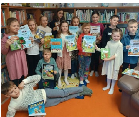
Školní kolo recitační soutěže