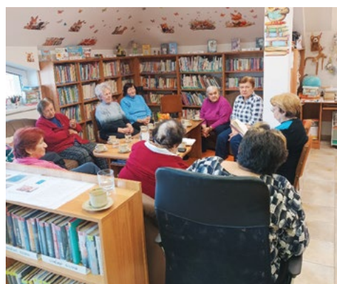
Beseda pro seniorky