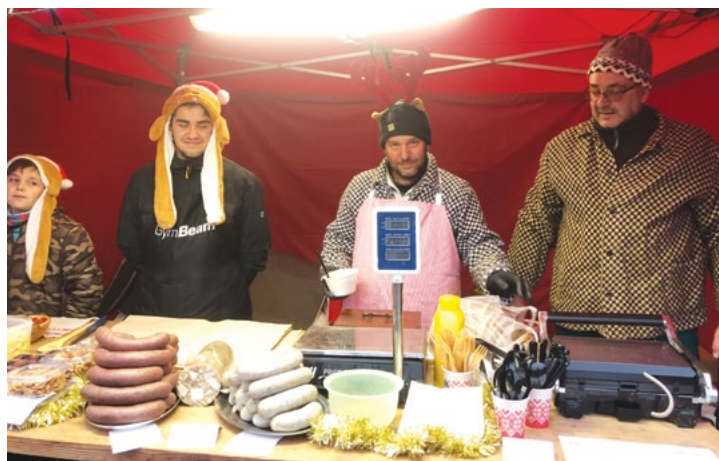
Je libo jelitko či jitrničku?