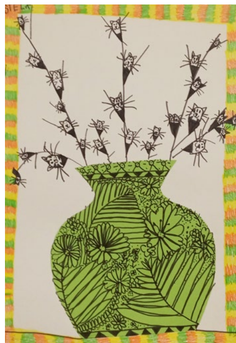
Rozkvetly nám „kočičky“