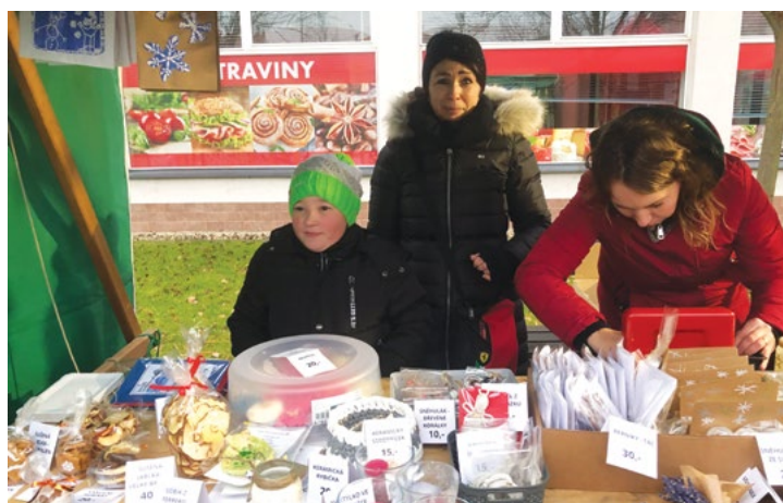
Zboží všeho druhu