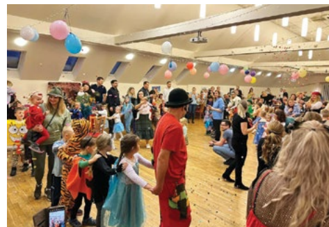
Jede, jede mašinka...