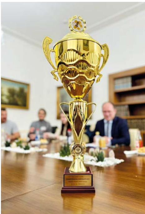
První místo a naše trofej