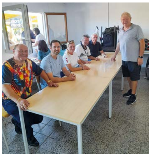
Gulášfest – odborná porota