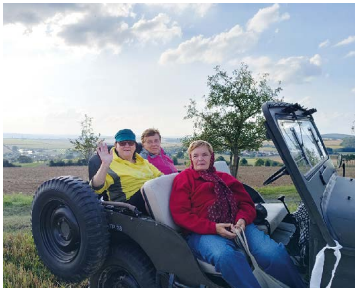
První várka výletnic