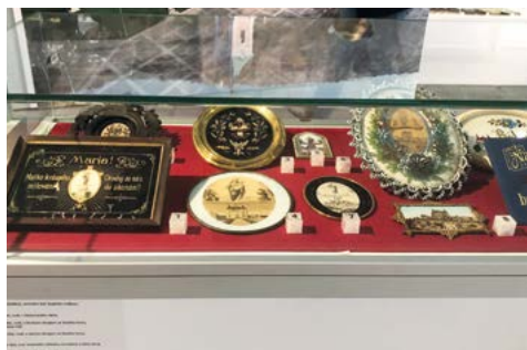
Výstava – památky z poutí