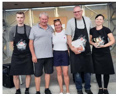
Segedin forever – 2. místo u poroty, 3. místo u návštěvníků