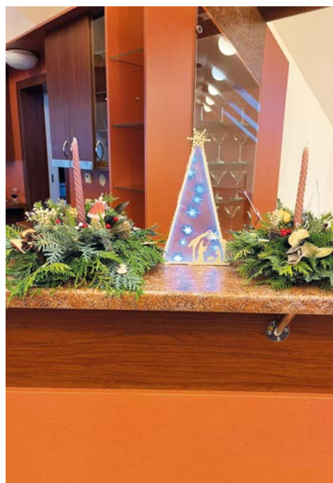
Advent u Gučabab