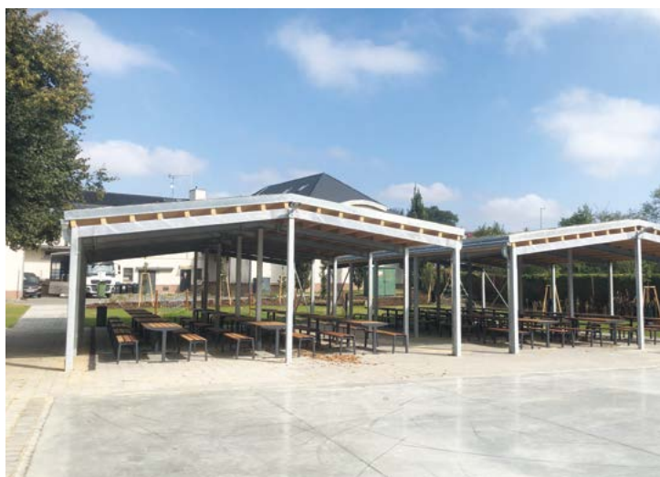
Dokončené výletišť, přední část zastřešeného prostoru

Vajdíkové k přestřížení pásky a krásně vydlážděný areál s novým altánem a taneční plochou uprostřed a zastřešeným posezením po obou jejích stranách začal sloužit sazovické veřejnosti. Všechny návštěvníky výletišť přivítala CM Luňák, která celé odpoledne hrála k poslechu i k tanci a při její hudbě se bavili nejen dospělí, ale vydováděly se i děti. Pro ně byly na „Zahrázce“ přichystány ještě další atrakce: několik skákacích hradů, obří kolo na střefování míčky, a dokonce i stánek s cukrovou vatou! Také dospělí měli možnost občerstvit se nejen v domečku, ale také v přistaveném pojízdném stánku, takže sváteční odpoledne proběhlo ke spokojenosti všech a změnilo se v pěknou sousedskou besedu.