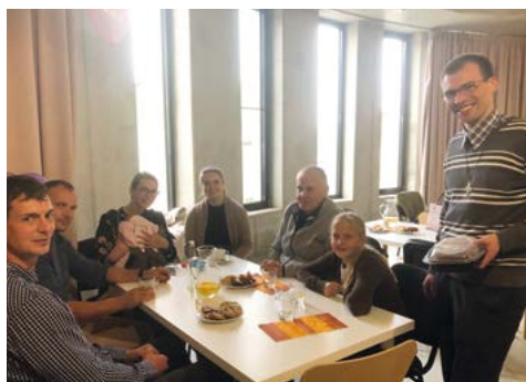
Občerstvení v suterénu