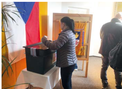
Volební účast - 73,15%