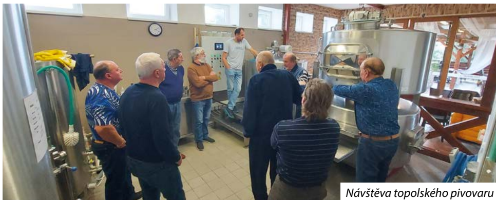
Návštěva topolského pivovaru

aktivním členům klubu se nám daří většinu našeho záměru plnit. A nebyli to jen aktivní členové, kteří se o to zasloužili. Tímto bych chtěl poděkovat všem občanům obce, kteří náš klub podporují, Obci Sazovice a našim sponzorům. Rádi bychom rozšířili naše řady o další členy. Proto vy, kteří splňujete podmínky člena klubu dovršením 60 let a trvalé-