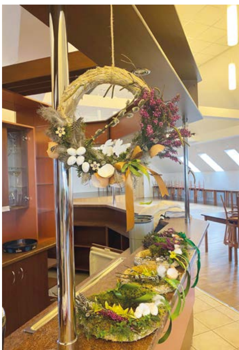
Naše jarní tvoření