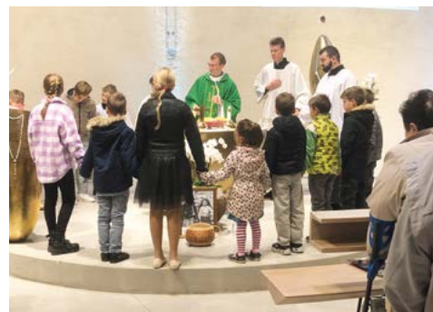
Společná modlitba Otčenáše