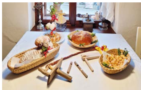
Velikonoce v muzeu