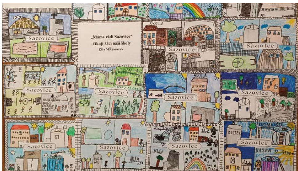
Sazovice očima školáků

Začátkem září byl v knihovně zaveden nový půjčovací systém eVerbis a prvních 14 dnů bylo půjčování knih složitější. Všechny půjčené knihy se musely zapisovat na papír a vrácené knihy čekaly, až bude program