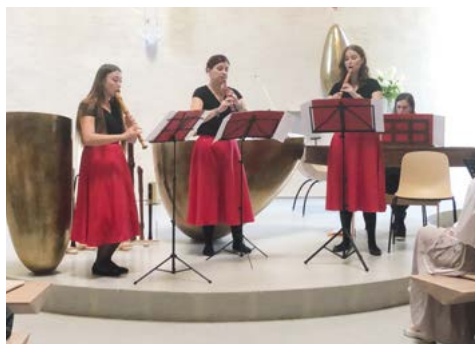
Koncert Tria LUMAE