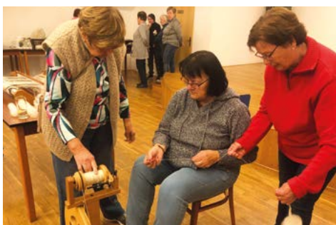
Předu, předu zlatou nitku