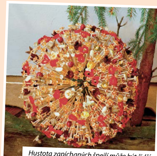
Hustota zapíchaných špejlí může být řidší.

Kulatým základem bývalo jablko, brambora nebo těsto. Dnes je možné použít i pomeranč nebo polystyrenovou kouli, kterou je ale vhodné potáhnout látkou. Nejprve si udělejte díрку skrz kouli. Protáhněte ji provázkem, který na spodním konci zakončíte korálkem nebo mašlí. Na horní straně koule ponechejte z provázku očko na zavěšení. Špejle rozstříhejte na půlky a navlékejte na ně dekorace – sušenou kůru z pomerančů nebo mandarinek, kterou jste ještě čerstvou nakrájeli na čtverečky nebo vykrájeli malými vykrajovátky. Na ozdobu můžete použít i další sušené ovoce – rozinky, švestky, případně popcorn, želé bonbony rozkrájené na kostičky nebo i kousky látek. Fantazii se meze nekladou. Špejle s ozdobami pak stejnoměrně zapíchejte do středové koule (jablka, pomeranče) tak, aby vytvořily sluneční papsky, a polaz je na světě.