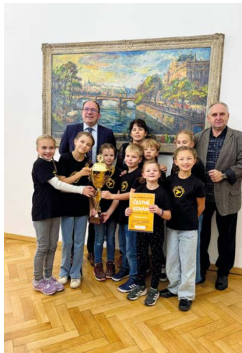
Společná fotka s panem ministrem a s p. Cafourkem

Přejeme vám krásné prožití vánočních svátků a v novém roce hodně zdraví a život sladký jako med od našich včelíček.