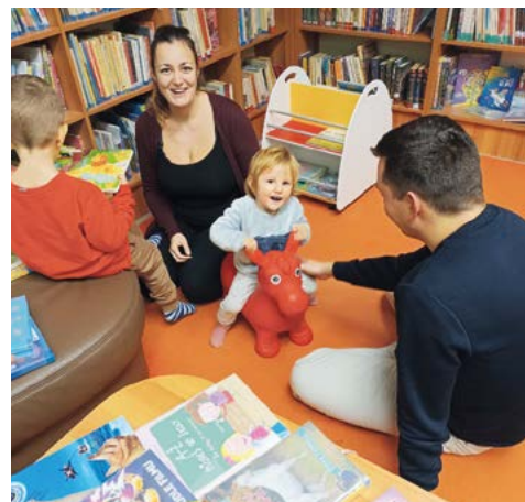
Pohoda pro celou rodinku