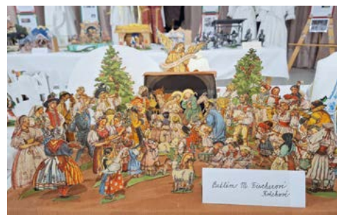
Loňská (papírová) podoba betlému