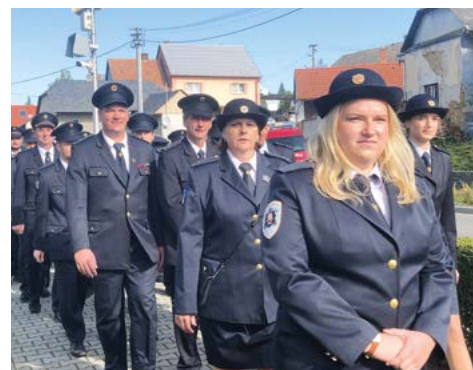
Hasiči – nedílná součást průvodu