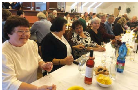
Pořád bylo o čem povídat