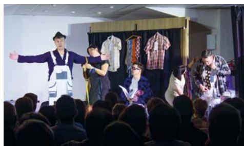
Když oblek, tak ze salónu U Adama

Škoda, že v naší celkem velké dědině chybí zájem o ochotnické divadlo a že se tu nebudou obětaví nadšenci, pro něž by „prkna znamenala svět“.