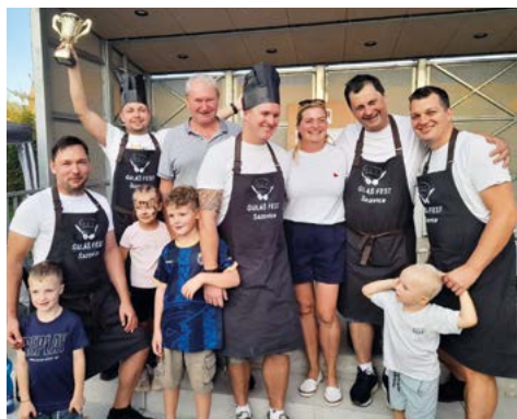
Správná parta – 1. místo v hodnocení návštěvníků