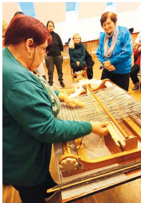
Tkaní na ručním stavu