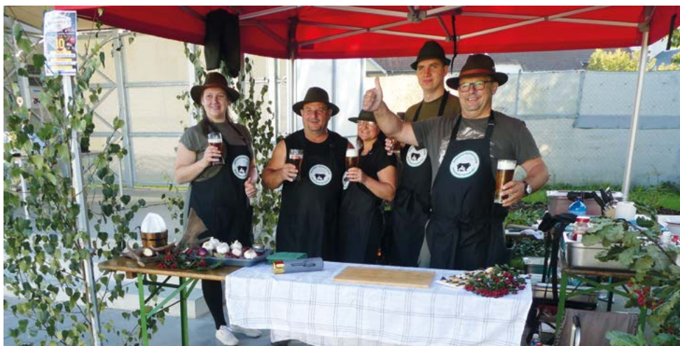
MS Háj - 1. místo v hodnocení odborné poroty