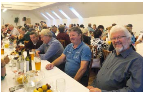
Chlapci stále jako květ

Zase už je podzim, kdy se každoročně setkávají sazovičtí senioři. Letos se jich ve společenském sále OÚ sešlo kolem sedmdesáti. Odpoledne vždy probíhá podle už ustáleného programu. Také letos přivítala přítomné nejdříve paní starostka, která je seznámila s průběhem celého odpoledne a večera. Nejprve si shromáždění senioři připomněli ty, kteří během roku odešli z tohoto světa. S těmito šesti občany se účastníci setkání rozloučili vzpomínkou, povstáním a chvílkou ticha. Následovaly gratulace seniorům, kteří letos oslavují životní jubileum. V tomto roce jich bylo 42. Každý oslavenec obdržel kytičku a „kulatí“ a „půlkulatí“ také obálku s finančním darem. Všem pak bylo určeno přání pevného zdraví, spokojenosti a pohody, aby jim nechyběla dobrá nálada, úsměv a především blízcí, kteří je mají rádi. Škoda jen, že řada oslavenců na setkání chyběla, ať už ze zdravotních či jiných důvodů, a tak kytičky pro ně zůstaly opuštěné... V Sazovicích žije momentálně