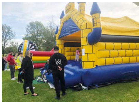
Jeden ze skákacích hradů