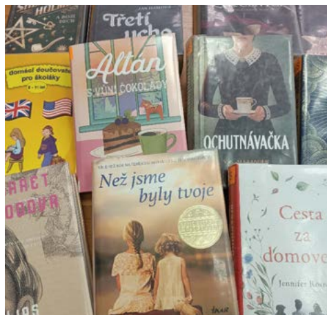
Nové knihy čekají na čtenáře