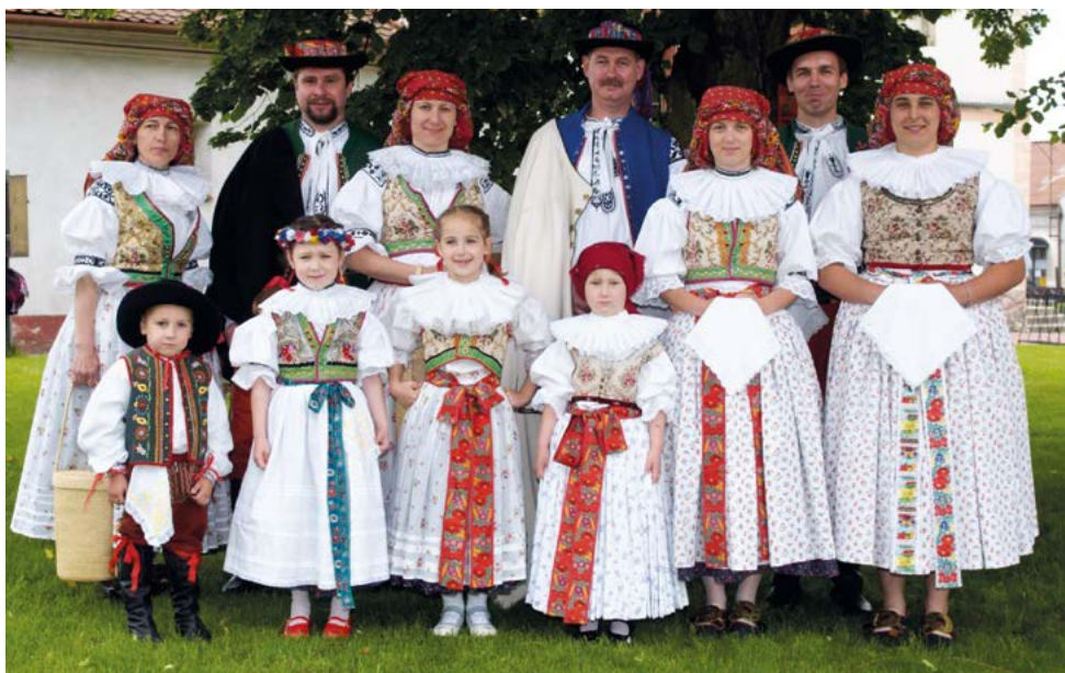
Členové Výboru pro udržování tradic Sazovice v obnoveném kroji

V příštím roce budou tedy Sazovice po deseti letech slavit nejen Starý hanácký právo, ale připomenou si také třicet let obnoveného místního kroje.