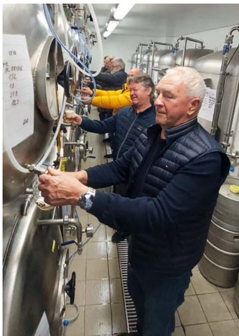
Už se to čepuje

Protože se blíží konec roku 2025, dovolte mi malé hodnocení činnosti klubu. Klub byl založen 11. 12. 2023. Při založení klubu jsme si předsevzali, co bude jeho náplní. Že to bude besedování, vzájemná výměna zkušeností, aktivní zájmová činnost, hry, soutěže, sportovní aktivity, ale i organizování anebo spoluorganizování některých akcí a také aktivní spolupráce s OÚ Sazovice. Po dvou letech činnosti klubu musím konstatovat, že díky