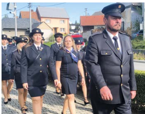
Oslava svátku sv. Václava