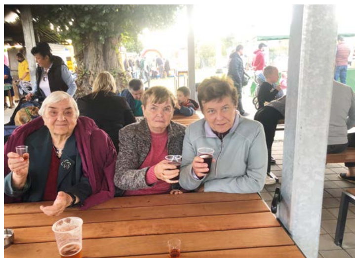
Pěkná beseda pod novým přístřeškem