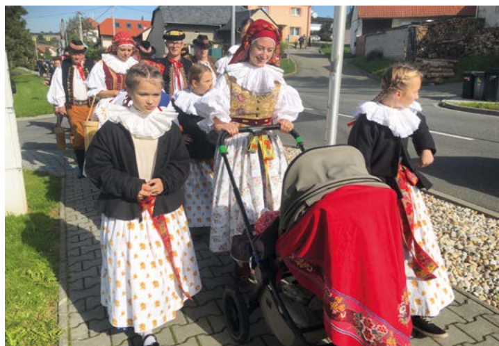
Konopka a spol.