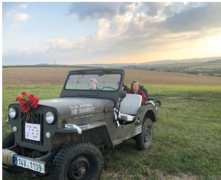
Daleké obzory kolem