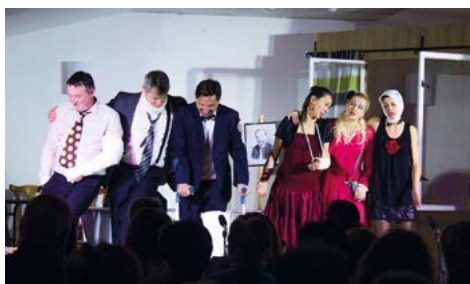
To jsme teda dopadli!