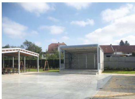
Taneční plocha a nový altán